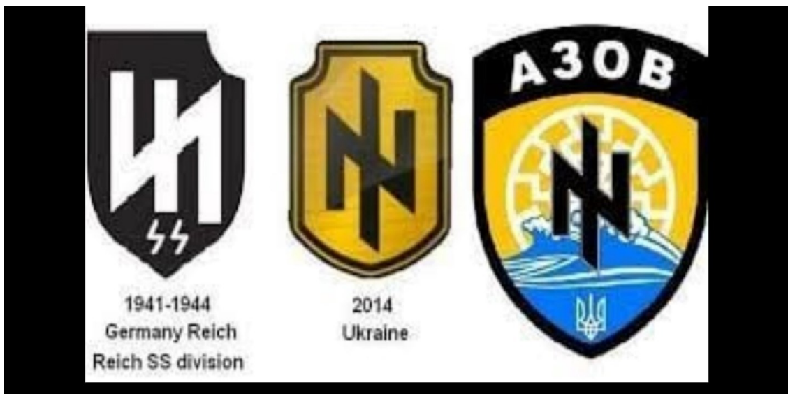
Рис. 2 Атрибутика украинских неонацистов и ее сходство с атрибутикой немецких нацистов прошлого века.