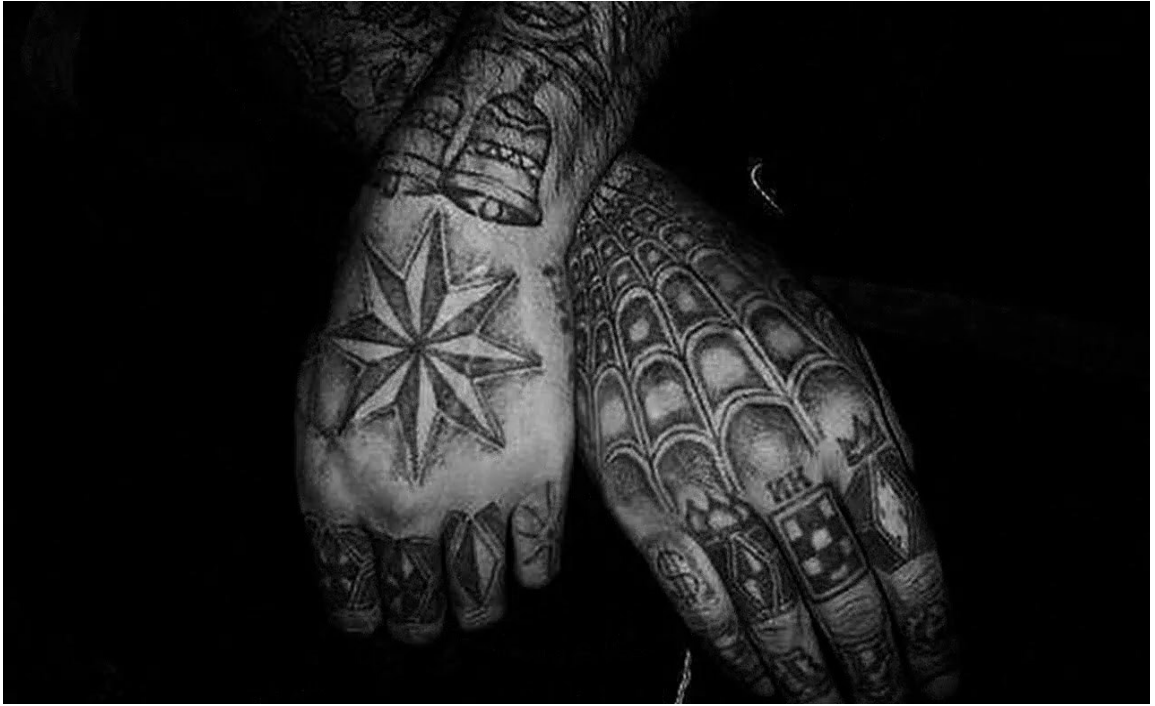
Иллюстрация 2. Примеры криминальных татуировок

Маркеры склонности к совершению акций типа «Колумбайн» 14 и (или) террористическим актам