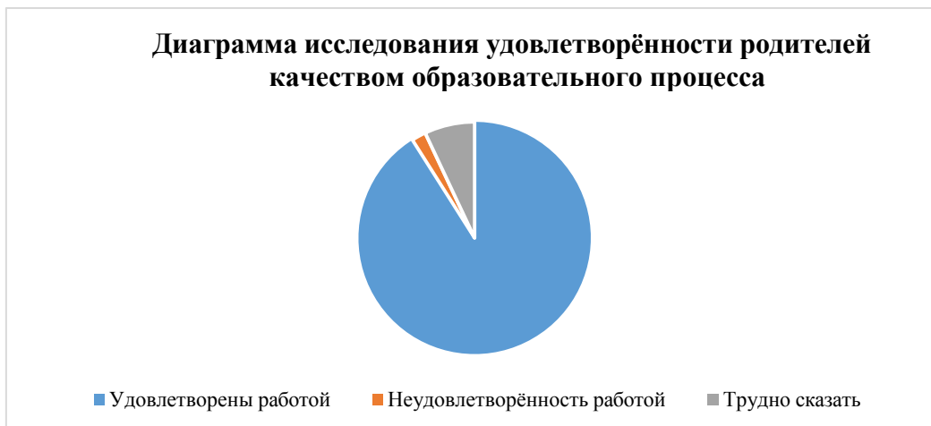
Диаграмма исследования удовлетворённости родителей качеством образовательного процесса