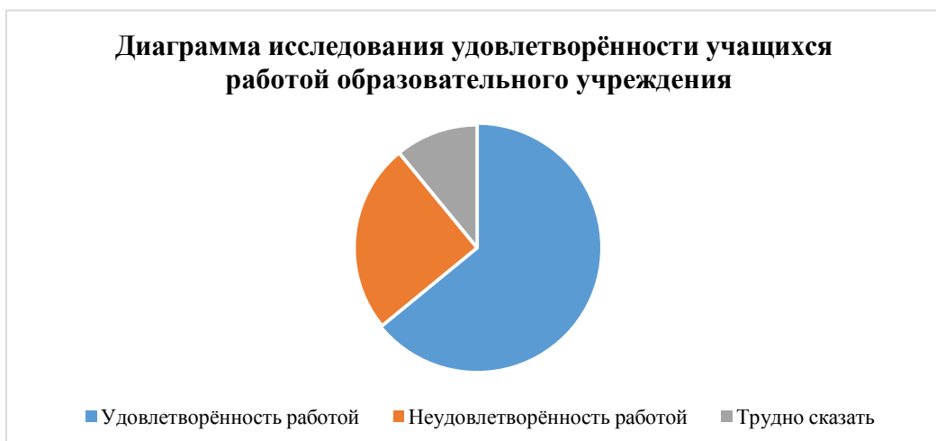
Диаграмма исследования удовлетворённости учащихся работой образовательного учреждения

Выводы: 91% родителей и 80% обучающихся удовлетворены работой образовательной организации.